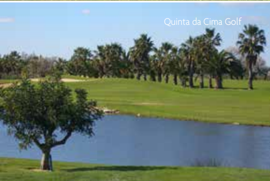
Quinta da Cima Golf