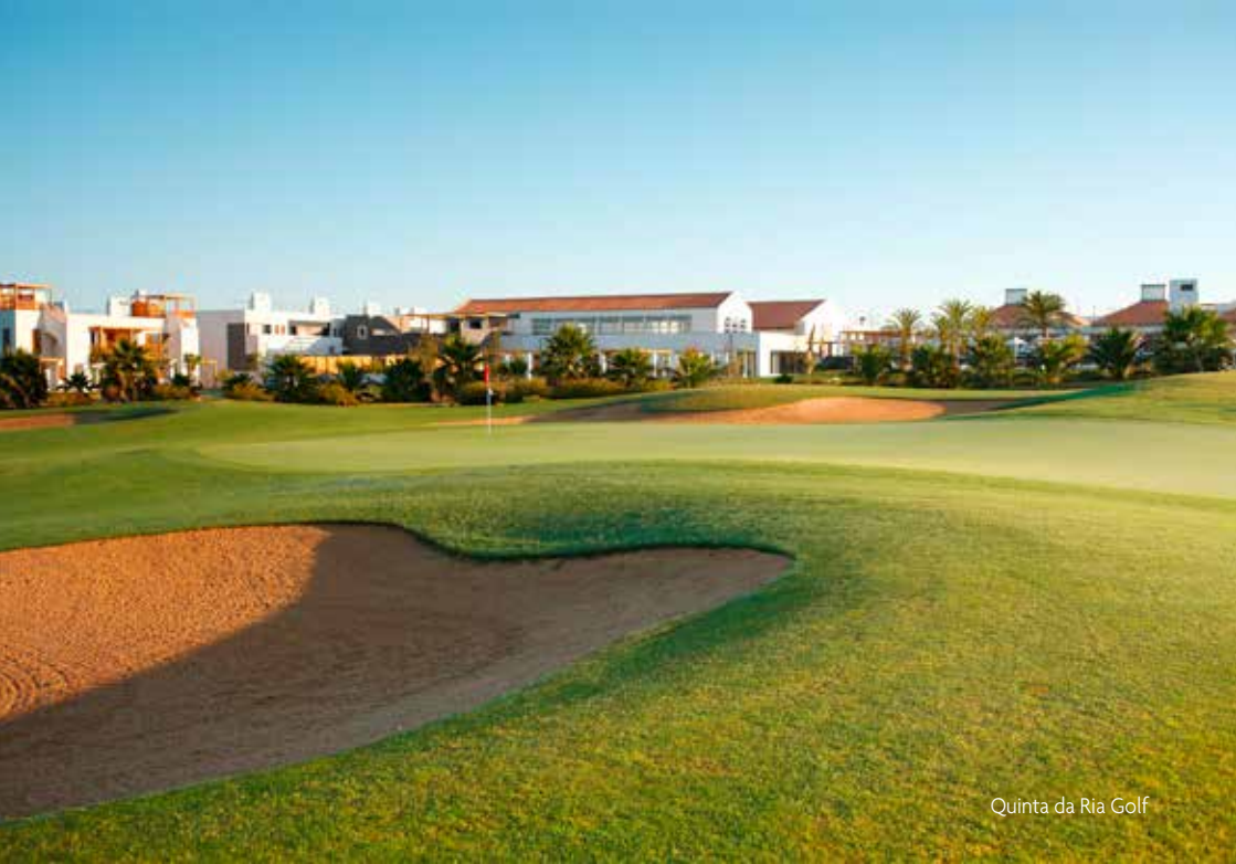
Quinta da Ria Golf