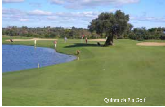
Quinta da Ria Golf

Greenfees verteilt auf: Quinta da Ria und Quinta da Cima