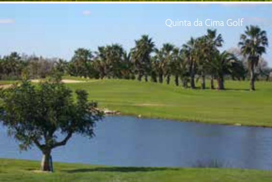
Quinta da Cima Golf