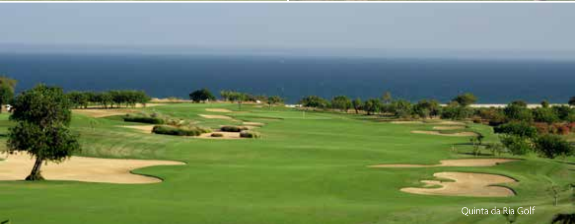
Quinta da Ria Golf