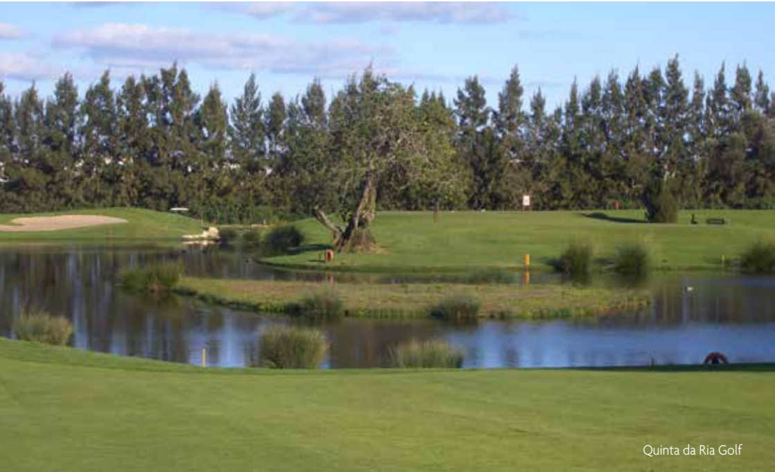
Quinta da Ria Golf